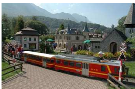
Swiss vapeur parc