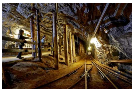
Mines de Sel de Bex